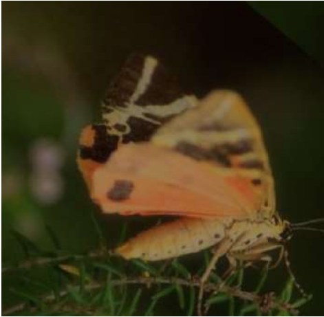
12 Probably the last butterfly left in this season

The Valley of the Butterflies , also known as "Petaloudes", is a unique nature reserve on Rhodes. It is particularly impressive in early summer and late summer, when thousands of butterflies, mainly the species "Panaxia quadripunctaria", fly into the valley. The butterflies find ideal conditions for breeding here, including lush vegetation and cool streams. Visitors can walk along paths through the valley and enjoy the beautiful natural scenery while observing the butterflies in their natural habitat. It is a magical place that shows nature and wildlife in all their splendour.