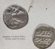
Αργυρέα, στήριγμα Λίνδου Archae. stater of Lindos

"Η Λίνδος είναι ο βράχος της" "Lindos is its rock" Χρ. Καρούζος • Ch. Karouzos