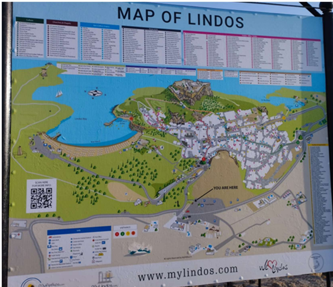
10 Map of Lindos at the town's entrance (red spot)