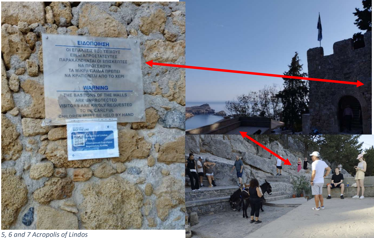
5, 6 and 7 Acropolis of Lindos

The ancient city of Lindos , located on the east coast of Rhodes, is a historical treasure. It is known for its impressive acropolis, which is perched on a hill and offers a breathtaking view of the Aegean Sea. The Acropolis of Lindos is an impressive example of ancient architecture and is home to relics from different eras, including a temple of Athena from the 4th century BC and the castle of the Knights of St John from the Middle Ages. The narrow streets of Lindos are lined with whitewashed houses and offer a picturesque scene and numerous shops where you can buy handicrafts and souvenirs.