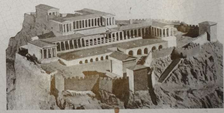
Προσκαίρια της ακρόπολης Λίνδου Model of the acropolis of Lindos