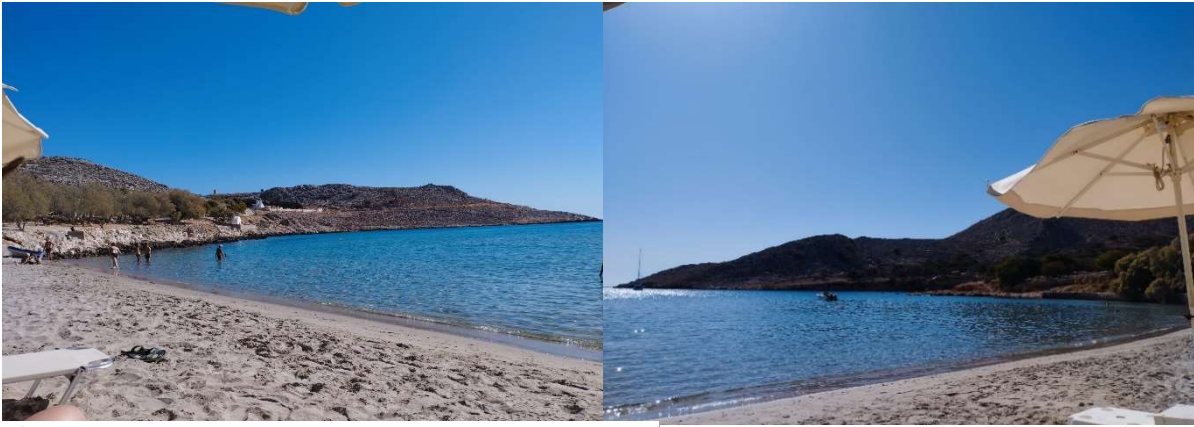
3/4 Taken after having a delicious lunch at charming Nick's Taverna at Pondamos Beach Bay, Halki

The ancient city of Lindos , located on the east coast of Rhodes, is a historical treasure. It is known for its impressive acropolis, which is perched on a hill and offers a breathtaking view of the Aegean Sea. The Acropolis of Lindos is an impressive example of ancient architecture and is home to relics from different eras, including a temple of Athena from the 4th century BC and the castle of the Knights of St John from the Middle Ages. The narrow streets of Lindos are lined with whitewashed houses and offer a picturesque scene and numerous shops where you can buy handicrafts and souvenirs.