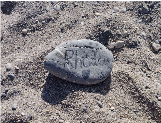
1 Found on the Mitsis Rodos Village Beach

(written on the beach after a strenuous day galivanting around the island and typed out back home in Germany)