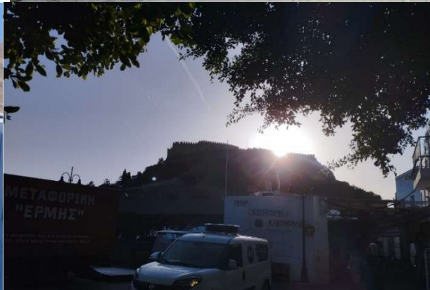
9 The bastion seen from the entrance to Lindos