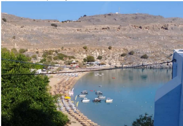
8 Lindos Beach seen from the bastion on top of the hill