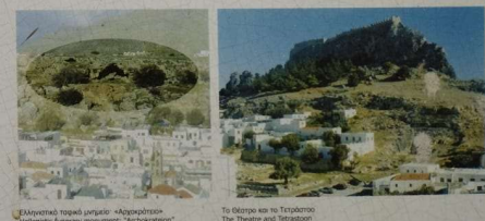
Ελληνιστικό τοπικό μνημείο - «Αρχοκράτορα» Hellenistic funerary monument, "Archokraton"