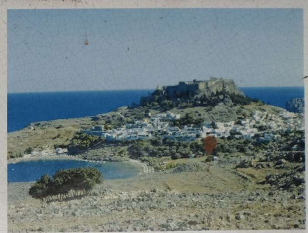
Γενική οπτική της Λίνδου • General view of Lindos