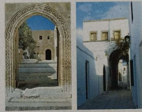
Στη Λίνδο διατηρείται ακόμη σπήλιον του 16ου - 17ου αι. γνωστό ως «καπετανικό» ή «καπετανιστήριο». Το κεντρικό, στην προέκταση από τον ναυαγιστήρα, καλύπτει το χώρο τους οικισμοί που υπήρξαν της βυζαντινής, αλληλ, σε σχήμα «Γ» ή «Π». Η είσοδος γίνεται από τον αυλάκι με το κλειδί. Σελίδα οδηγού από την επανέκδοσή του στο «Βιβλίο της Καρπίνης», τον αιώνα.