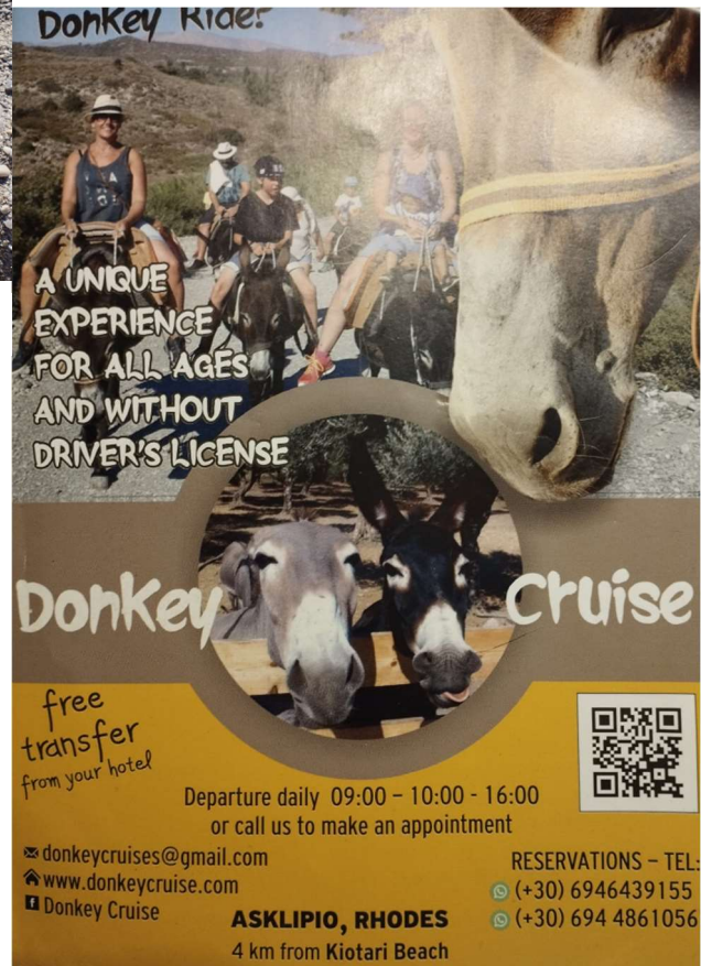
2 Donkey Cruise pamphlet

Plan your next holiday on the beautiful island of Rhodes - the sunny jewel of the Aegean! Rhodes really is a delightful island with a fascinating history and a relaxed atmosphere that makes it a great holiday destination.